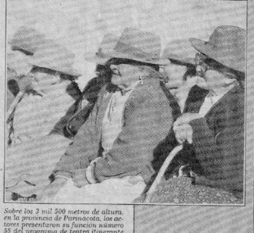
Sobre los 3 mil 500 metros de altura, en la provincia de Parícuta, los actores presentaron su función número 55 del programa de teatro itinerante.