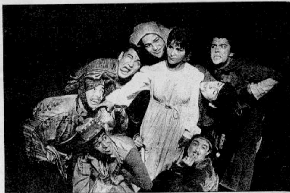
El Teatro Luna, por excelencia valdiviano, es uno de los pocos teatros itinerantes existentes en el país.

El Teatro Luna y el Ministerio de Educación invitan a los valdivianos al estreno, para lo cual pueden solicitar invitaciones en la Corporación Municipal de Cultura, ubicada en el cuarto piso del edificio consistorial.