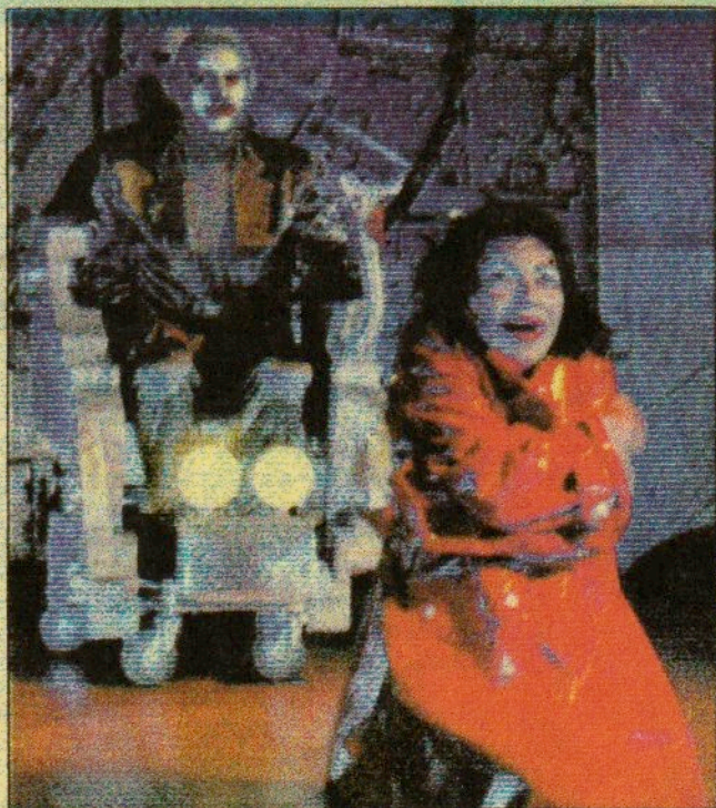
'Momo', la niña que lucha por recuperar el mundo feliz, discute con uno de los hombres de gris.